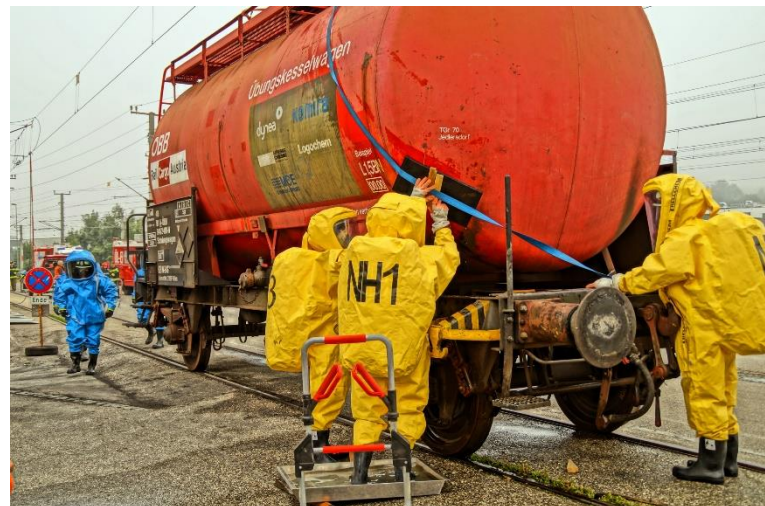
VS-Träger beim Abdichten eines Kesselwagens