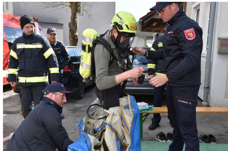
Auskleiden eines VS-Trägers