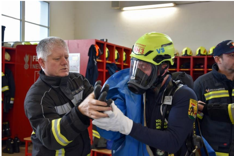
Ankleiden eines VS-Trägers