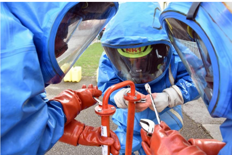
Dichtungswechsel bei einer Rohrleitung