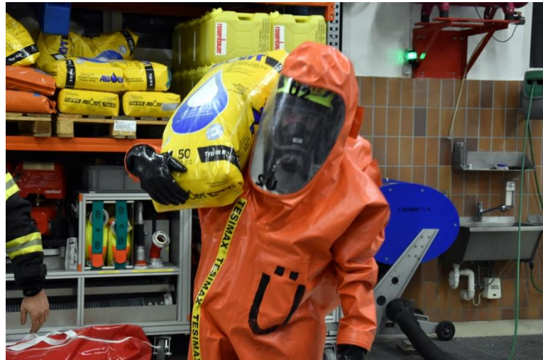
Belastungsübung eines VS-Trägers