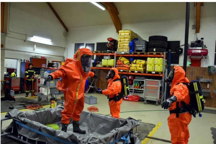
Not-Dekon eines VS-Trägers