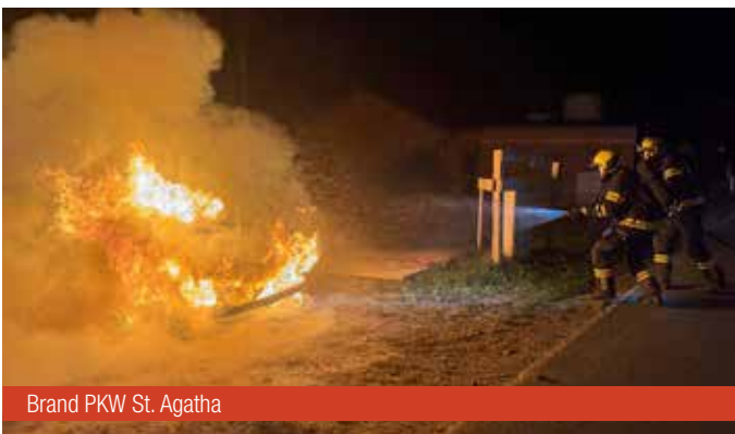
Brand PKW St. Agatha