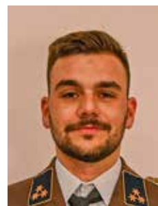
HBI d.F. David Floimayr Presse und Öffentlichkeitsarbeit