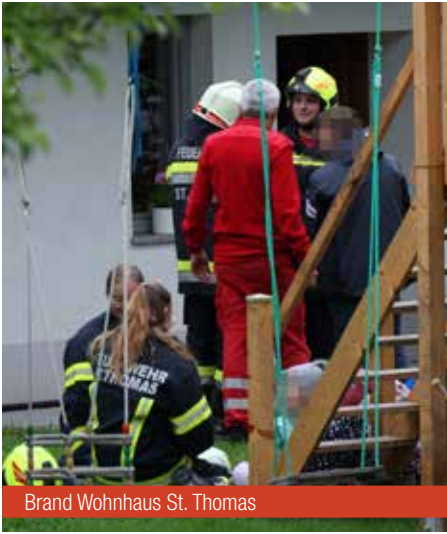
Brand Wohnhaus St. Thomas