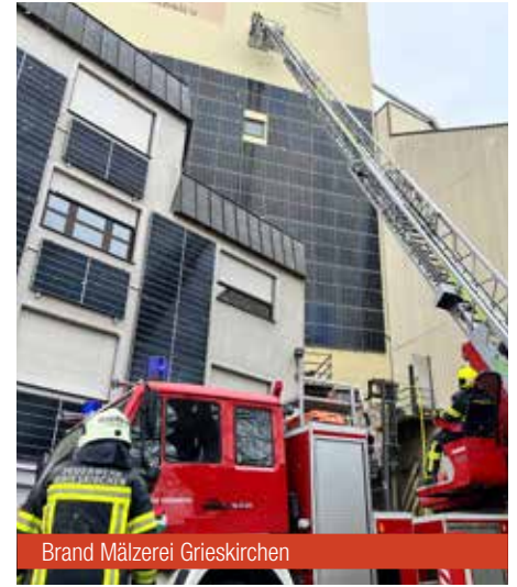
Brand Mälzerei Grieskirchen