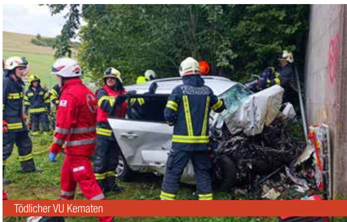
Tödlicher VU Kematen