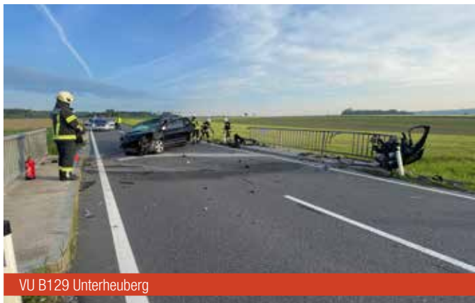
VU B129 Unterheuberg