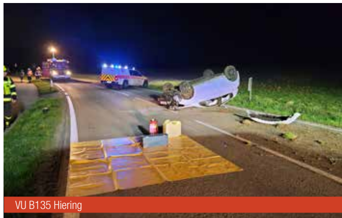
VU B135 Hierung