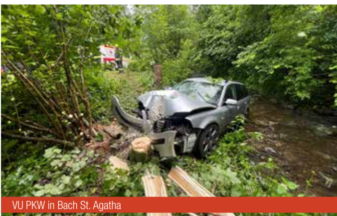
VU PKW in Bach St. Agatha