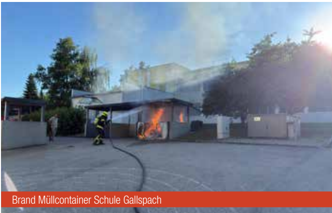
Brand Müllcontainer Schule Gallspach