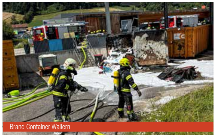
Brand Container Wallern