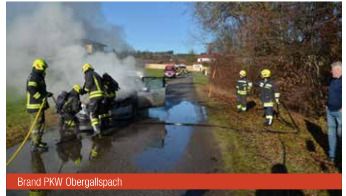
Brand PKW Obergallspach