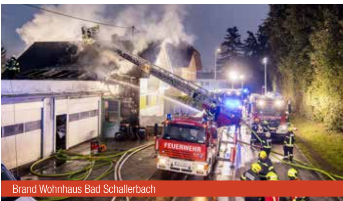
Brand Wohnhaus Bad Schallerbach