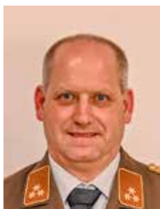
HBI d.F. Markus Wenzl Atenschutz