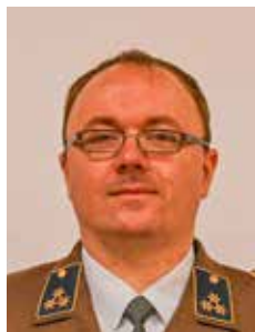
HBI d.F. Christian Pillinger Funk und LuN-Dienst