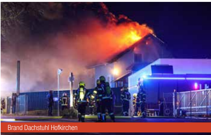
Brand Dachstuhl Hofkirchen