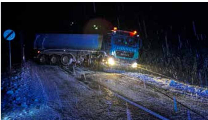
LKW Bergung Kematen