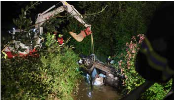
VU PKW in Bach Taufkirchen