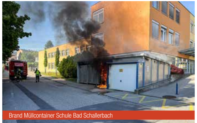
Brand Müllcontainer Schule Bad Schallerbach