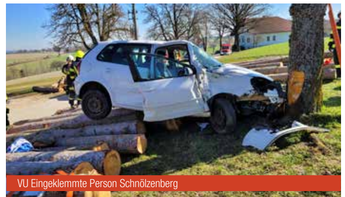
VU Einklemmte Person Schnölzenberg