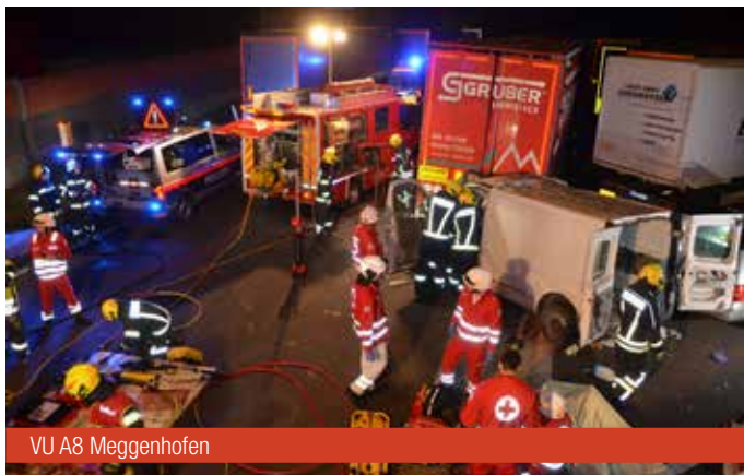
VU A8 Meggenhofen