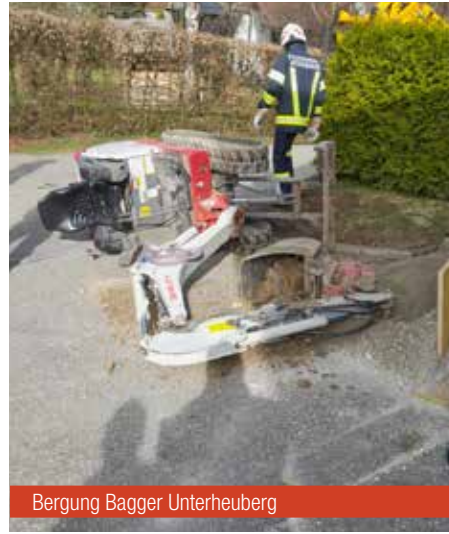
Bergung Bagger Unterheuberg