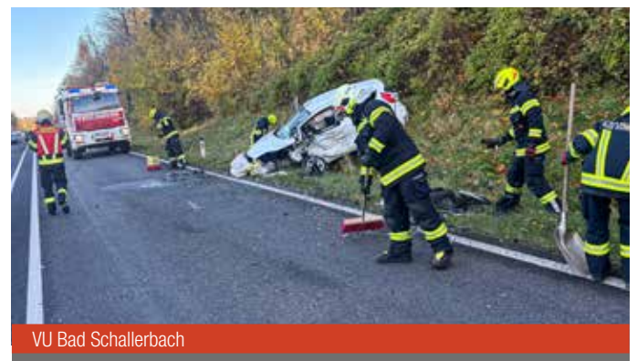
VU Bad Schallerbach