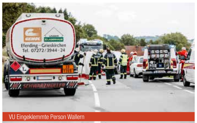
VU Eingeklemmte Person Wallern