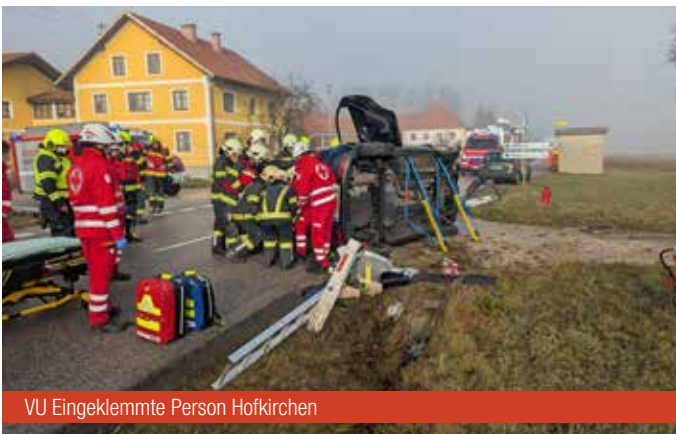
VU Eingeklemmte Person Hofkirchen