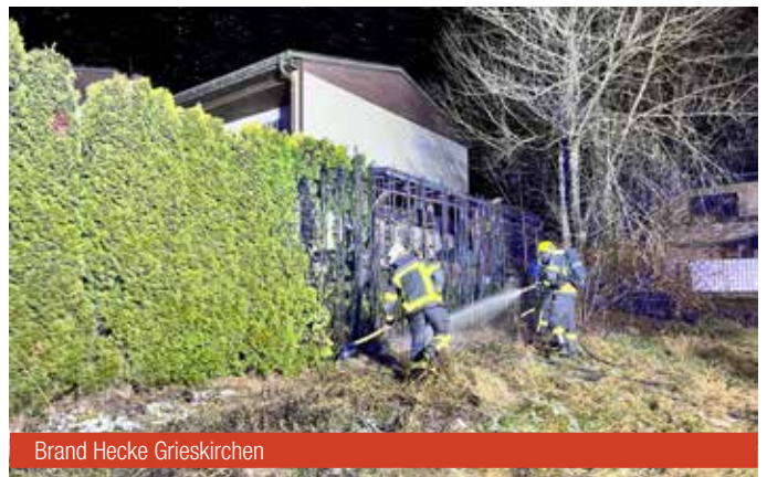
Brand Hecke Grieskirchen