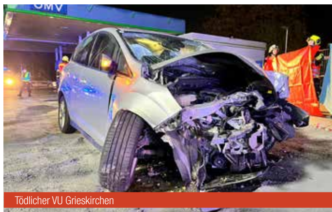
Tödlicher VU Grieskirchen