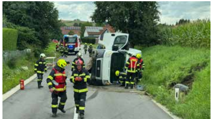
VU Eingeklemmte Person Gaspoltshofen