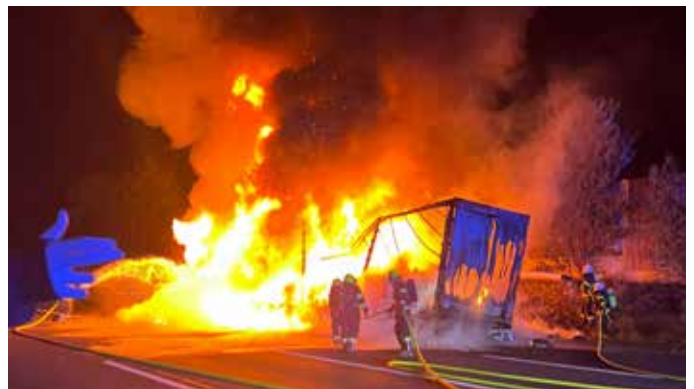
LKW Brand A8 Kematen