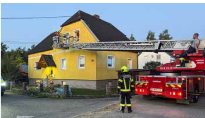
Personenrettung Bad Schallerbach