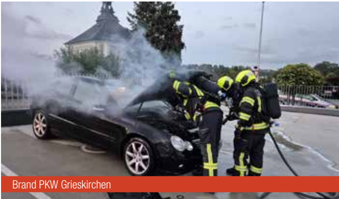
Brand PKW Grieskirchen