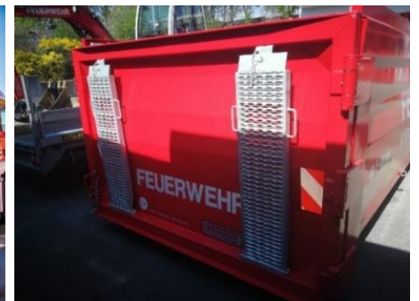
Rückwand, Schwenktür rechts öffnend, inkl. Auffahrrampen