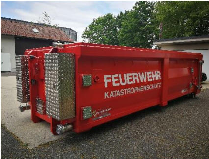
Geräteboxen an der Vorderseite

Einsatztaktische Unterlagen für die Beratung des Einsatzleiters werden mitgeführt, in denen auch die Möglichkeiten für die fachgerechte Entsorgung des kontaminierten Löschwassers enthalten sind.