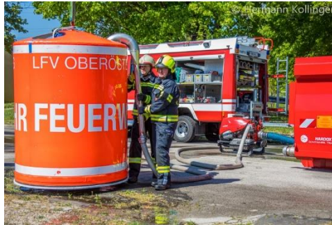
Wasserentnahme über TS