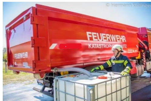
Ablassen von z.B. kontaminiertem Löschwasser in IBC-Behälter